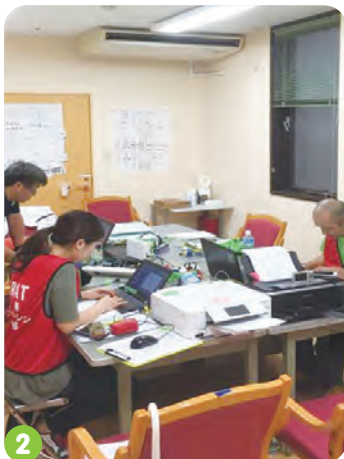
1. 医療支援チームミーティング 2. JRAT現地対策本部