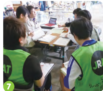
6. 多職種で行う避難所の評価 7. 地域のスタッフへの情報の共有と引き継ぎ