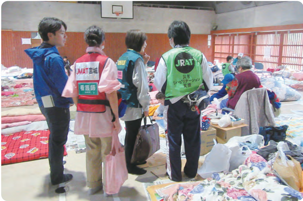
避難所を訪問し、状況を伺いリハビリテーショントリアージを行うところ