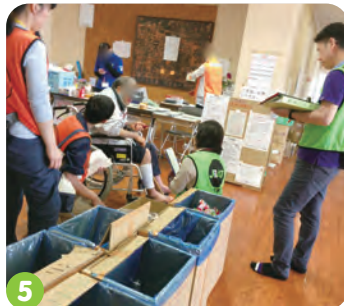
3. JRAT内での活動ミーティング 4. 他団体との情報共有のための会議 5. 保健師と協働した個別評価